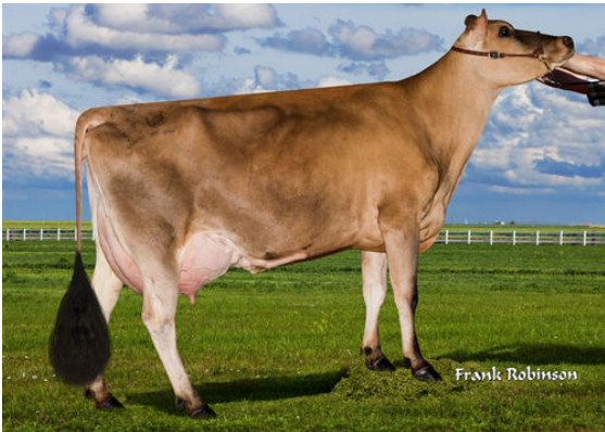
JX FARIA BROTHERS HULK YAYA TOURE {2}